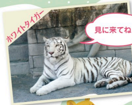
ホワイトタイガー