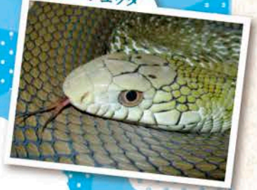
ヨナグニシュウダ

爬虫類第二段!今回ご紹介するのはヨナグニシュウダという蛇。「ヨナグニ」からもわかる通り与那国島に生息しており、「シュウダ」は臭蛇、身を守るための行動の一つとして防御臭という強烈なおいを発する蛇です。実際の手触りはざらざらとしているようですが、マットPP加工の表紙を彷彿とさせる鱗が魅力的な暗緑色を主として白の斑点が混じる体に、鋭い眼差しが印象的な美貌の持ち主。沖縄では展示している動物園もあり、私は沖縄こどもの国の爬虫類舎で実物を拝むことができました。しなやかに動く姿が美しく、少しでも長く見ていたいと予定外の長時間滞在をしてしまった記憶があります。